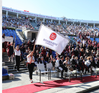
Class of 2022